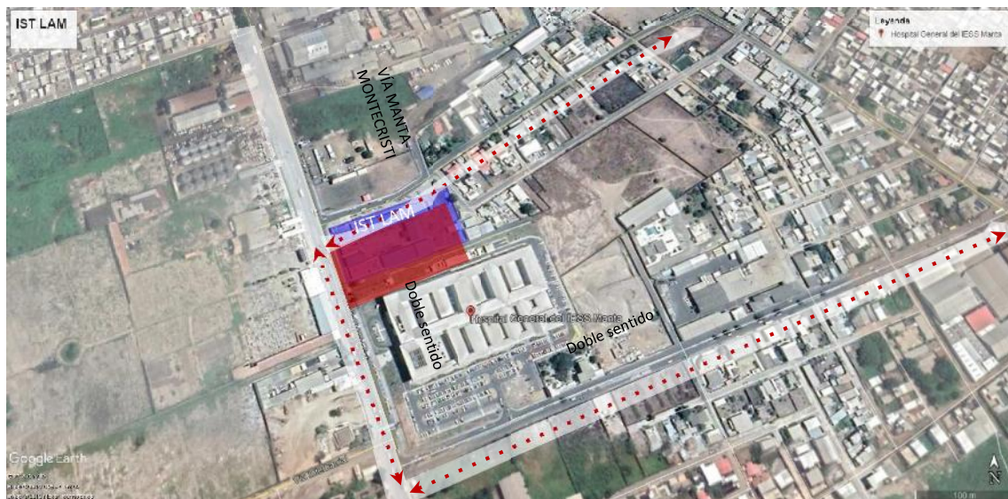
GRÁFICO 2 ACCESIBILIDAD AL PREDIO